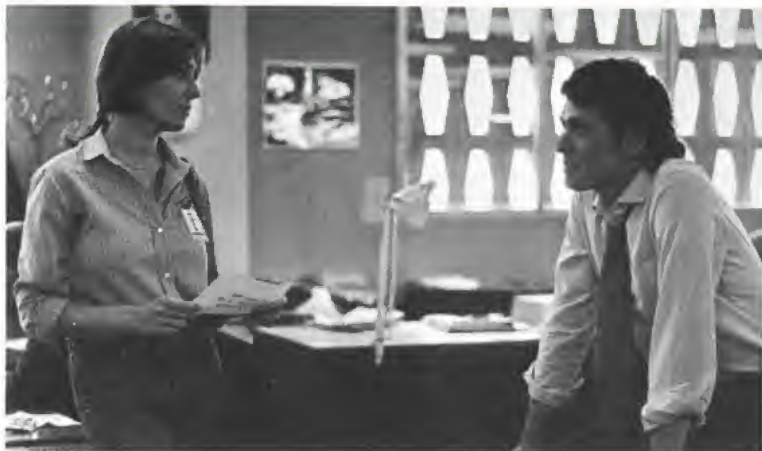
Mercedes Sampietro – Jon Finch